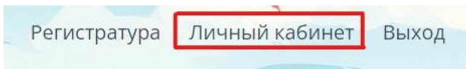
Рис. 5 «Меню Личный кабинет»

В верхней части страницы (см. рис. 5) нажмите на меню «Личный кабинет», после чего откроется страница личного кабинета (см. рис. 6).